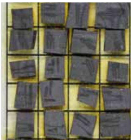
Stukjes rubber uit een pistooldemper. De lijntjes zijn de sporen die de laser heeft gemaakt tijdens de analyse.

Ingewikkelder wordt het, wanneer ze overeenkomsten vinden. Van Breukelen: "Dan moet je jezelf de vraag stellen: wat zegt die overeenkomst? Bijvoorbeeld bij een vergelijking tussen twee kaarsen. Als je een overeenkomst vindt, dan is de vraag: hoe groot is de kans dat je toevallig ook bij andere kaarsen die samenstelling ziet? In de praktijk blijkt dat dat niet zo heel erg waarschijnlijk is. Dat verhoogt de bewijswaarde. Maar dat weten we niet van tevoren. Dat weet je pas als je een grote populatie hebt gemeten." Van een aantal veelvoorkomende materialen bij forensisch onderzoek, zijn al op grote schaal metingen gedaan (zie kader Populatieonderzoek op pagina 8). Daarbij is van hetzelfde materiaal, afkomstig van dezelfde en verschillende leveranciers in Nederland, de