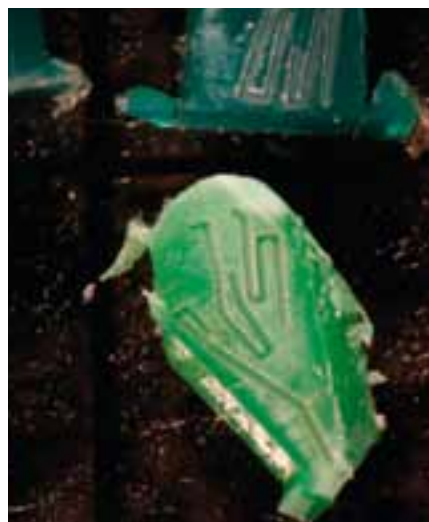
Stukjes kunststof van een jerrycan.